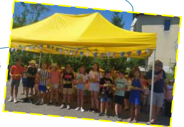
22 Juin Remise de calculatrices et clés USB aux CM2.