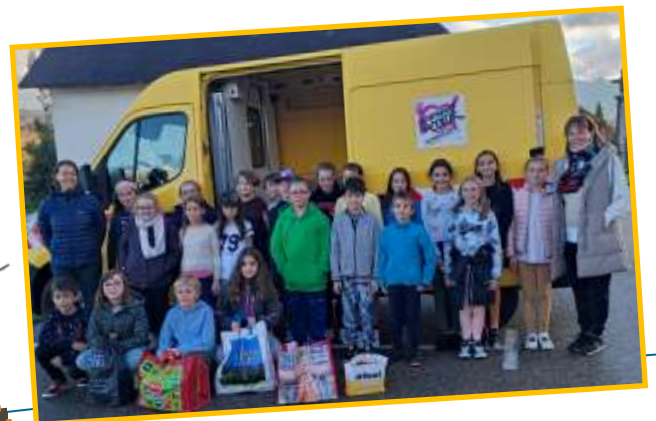
20 Novembre Journée Droits de l'Enfant.