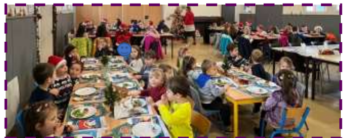
15 Décembre repas de Noël à la cantine.