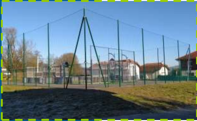
07 Février installation d'un pare-balls au terrain multisports.