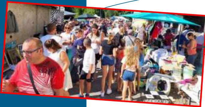
4 Septembre brocante/vidé-grenier