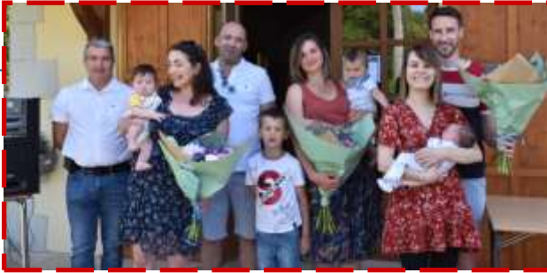
30 Mai Fête des mamans