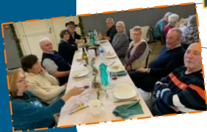
20 Novembre Repas des Aînés.