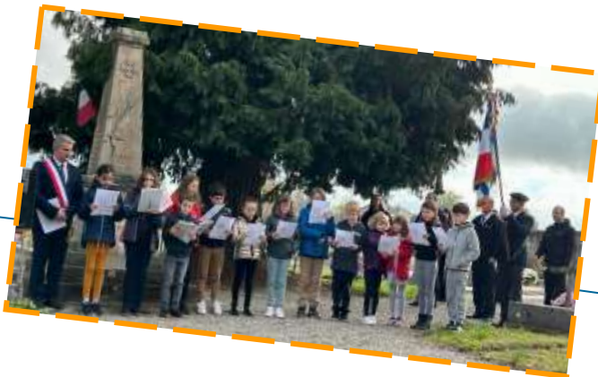
11 Novembre Commémoration Armistice.