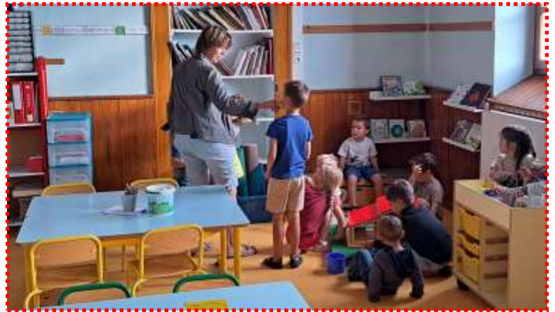
Classe de maternelles.