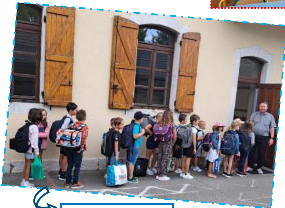
Classe de CP, CE1 et CE2.