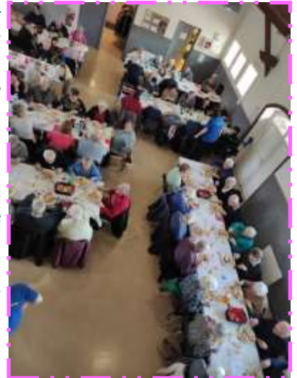
L'équipe du CAB.

Nous remercions également tous les bénévoles qui sont venus nous aider pour que cette journée soit un succès.