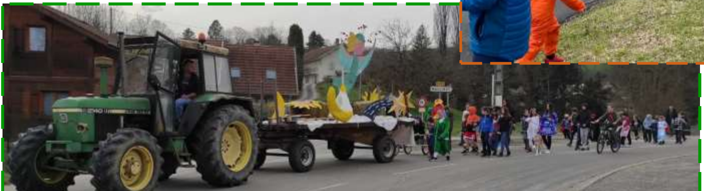
L'équipe de l'APE. La présidente.