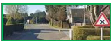
Exemple de priorité à droite avec signalisation.

La priorité à droite ne s'applique donc pas lorsque l'utilisateur venant de droite sort d'une voie privée, d'une impasse privée, ou d'un chemin de terre, ni lorsque le franchissement d'un trottoir est nécessaire pour sortir d'un parking.