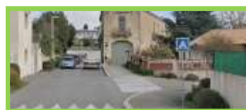
Exemple de priorité à droite sans signalisation, marquage au sol.

2) Cédez-le-passage : L'article R415-7 du code de la route est explicite : "À certaines intersections indiquées par une signalisation dite "Cédez le passage", tout conducteur doit céder le passage aux véhicules circulant sur l'autre ou les autres routes et ne s'y engager qu'après s'être assuré qu'il peut le faire sans danger." Quel est l'ordre de passage ? C'est le véhicule qui se positionne à droite qui a la priorité, et ce quelle que soit sa direction. À partir du moment où un conducteur voit un véhicule sur sa droite, en l'absence d'indication contraire, il doit le laisser passer.