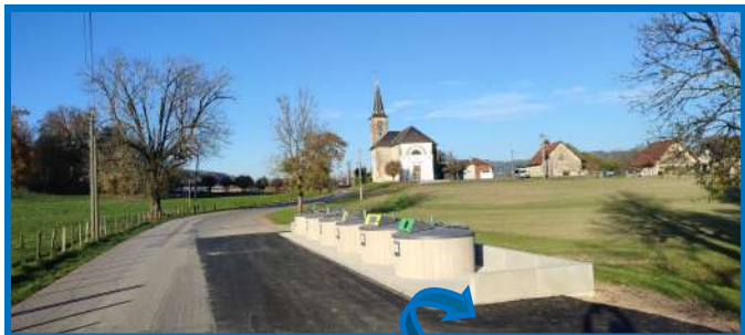
Fin des travaux