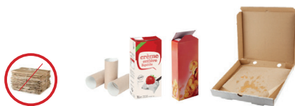
Emballages en papier et carton